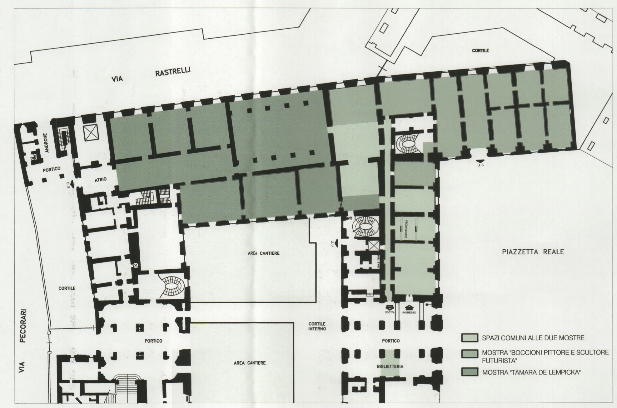
PLANIMETRIA SALE ESPOSITIVE PALAZZO REALE PIANO TERRA - SCALA 1:500